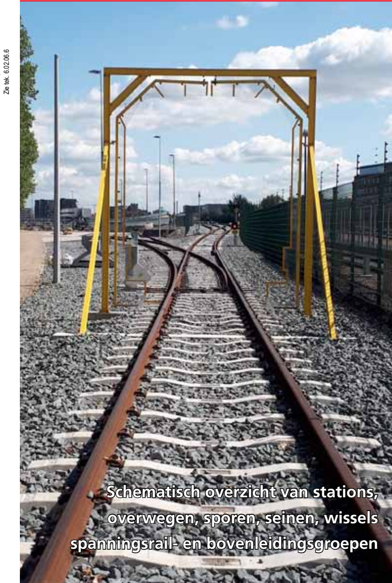
Schematisch overzicht van stations, overwegen, sporen, seinen, wissels spanningsrail- en bovenleidingsgroepen

Dit sporenplan is een product van de afdeling R&V. Foto: Hans de Lange