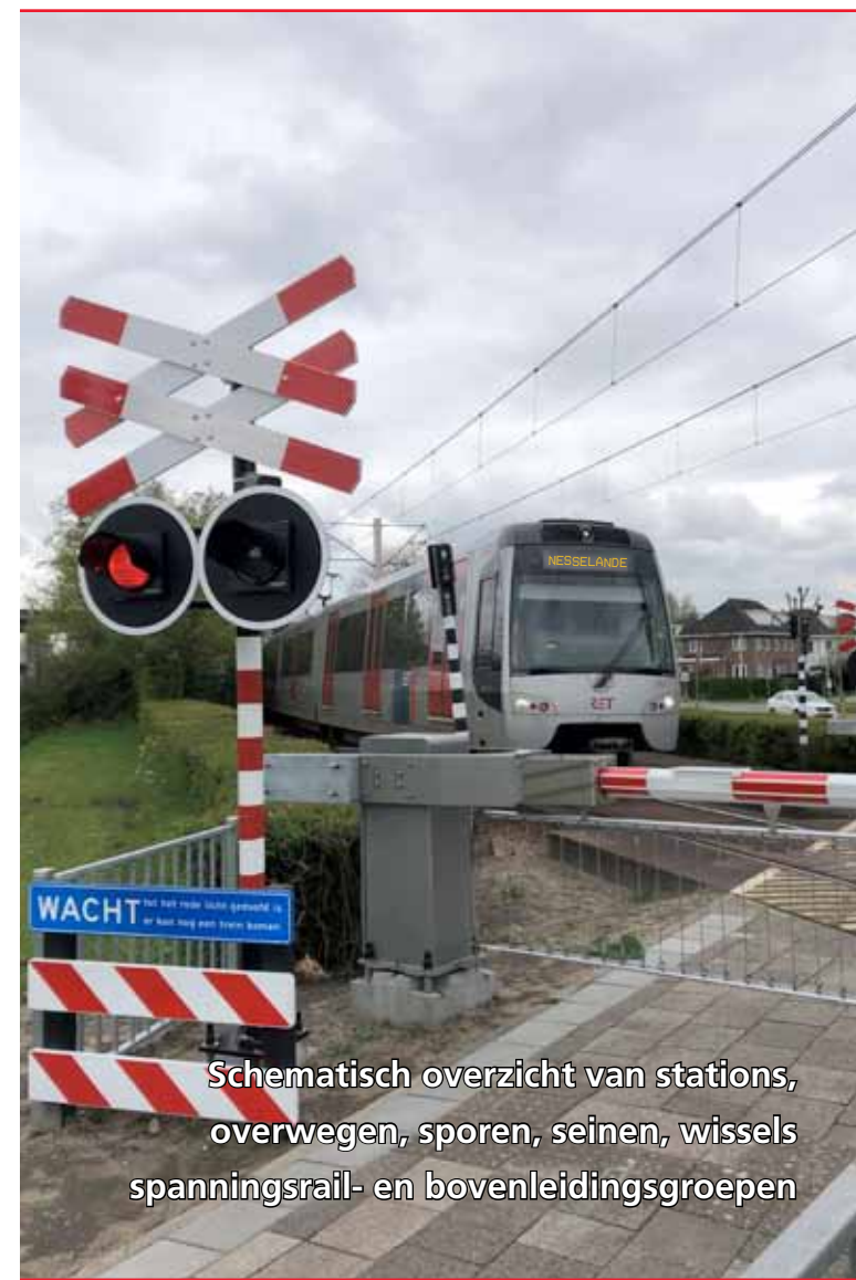
Schematisch overzicht van stations, overwegen, sporen, seinen, wissels, spanningsrail- en bovenleidingsgroepen

Dit sporenplan is een gezamenlijk product van de RET-afdelingen AM, BBE en V&M. Dit sporenplan is met de grootst mogelijke zorgvuldigheid samengesteld. Het is echter niet uitgesloten dat de werkelijke situatie afwijkt. Aan de inhoud van dit sporenplan kunnen op geen enkele wijze rechten of aanspraken worden ontleend. RET sluit elke aansprakelijkheid uit voor schade die voortvloeit uit het gebruik van dit sporenplan.